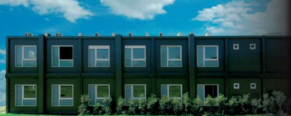
Clădire birouri - PROGRESS